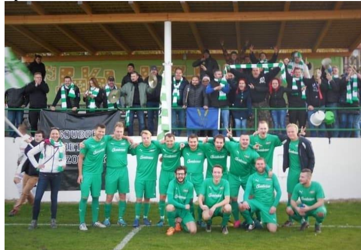
Hospodář fotbalového oddílu a člen výboru TJ Sokol Kozolupy